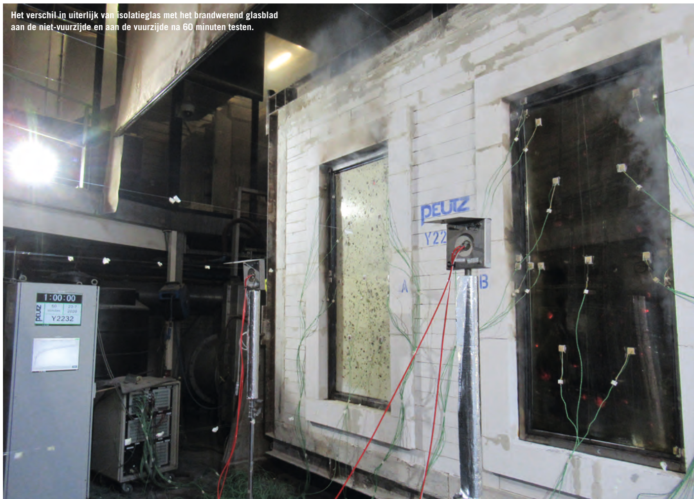
Het verschil in uiterlijk van isolatieglas met het brandwerend glasblad aan de niet-voorzijde en aan de voorzijde na 60 minuten testen.

gende scheidingswand, zonder meer toe te passen in een deurblad. Wel zijn de regels voor het wijzigen van de glassamenstelling of wijze van glasplaatsing gelijk aan de normen voor niet-dragende scheidingswanden: EN 1364-1 voor het direct toepassingsgebied en EN 15254-4 voor het uitgebreid toepassingsgebied. Vandaar dat de normen voor het uitgebreid toepassingsgebied van deur- en raamconstructies hiernaar verwijzen.