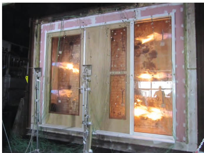
Bij een deurentest mag in het direct toepassingsgebied het glas van de zijlichten niet worden vergroot.

De brandwerendheidsclassificatie, bijvoorbeeld EI 60, of E 20, heeft betrekking op de hele constructie waarin het glas is getest. Daardoor is het bijvoorbeeld niet mogelijk om glas dat is getest in een niet-dra-