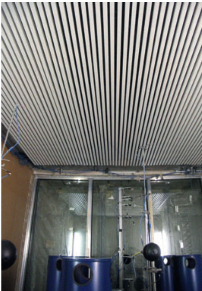
Klimaatkameronderzoek. Metalen lamellenplafond, circa 58 procent bedekt.

Eén van de optredende effecten bij toepassing van een open verlaagd plafond (plafondeilanden) is, dat door het verkleinen van het geluidabsorberend oppervlak de geluidabsorptie niet in alle frequentiebanden in gelijke mate afneemt. Uit metingen volgens ISO 354 met verschillende plafondconfiguraties blijkt