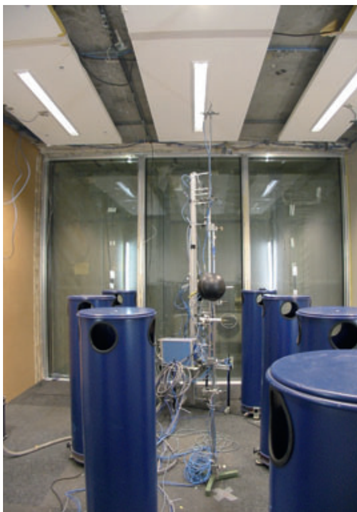
Klimaatkameronderzoek. Mineralewolplafond, 48 procent bedekt.

In talloze (kantoor)gebouwen is inmiddels BKA toegepast om ruimten op een duurzame en kosteneffectieve manier te koelen en te verwarmen. Bij BKA wordt er in de vloerconstructie een waterleidingnet aangebracht dat wordt aangesloten op