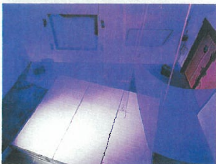
AKUSTIK-LABOR VON PEUTZ: In einem Hallraum werden Baumaterialien und Konstruktionen wie Theaterstühle auf ihre Schallabsorption hin untersucht.