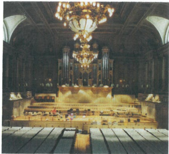
HISTORISCH: Der klassizistische Konzertsaal im Stadtcasino Basel von 1778 war in seiner „Schuhkarton“- Bauweise Vorbild für viele andere Säle.

Die Nachhallzeitkurve (blaue Kurve der Grafik) weist ein ausgeprägtes Maximum bei 1 Kilohertz auf, was die Brillanz dieses Saales erklärt. Dieser Konzertsaal ist ein Erlebnis, das man am besten mit einem Programm »