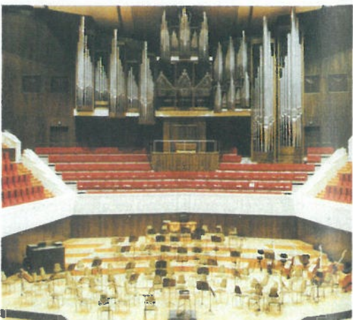
PRESTIGETRÄCHTIG: Das Gewandhaus in Leipzig von 1981 wahrt die gute Klangtradition seines Namens.