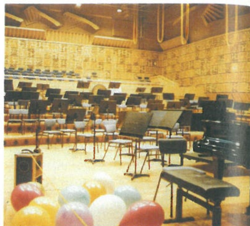
UNGEWÖHNLICH: Gemeinsam mit Architekten gestaltete Treppendiffusoren sorgen im Studio MCO5 des niederländischen Rundfunks für genügend Diffusität.

Das Studio MCO5 gehört zum Musikzentrum des Niederländischen Rundfunks in der Medienstadt Hilversum und dient vor allem als Aufnahme- und Probenraum für die großen Radiosinfonieorchester der Niederlande. Ziel beim Entwurf des durch Peutz beratenen, 16 000 m 3 großen Quadersaals war die akustische Nachbildung der Klangeigenschaften des berühmten Concertgebouw Amsterdam bei einem zugleich hervorragenden Klang für Orchesterproben und