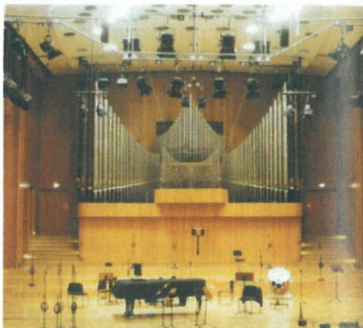
OPTIMIERT: Im Großen Sendesaal des WDR Köln wird Musik verschiedenster Stile aufgeführt und aufgenommen – von Bruckner über Jazz bis Weltmusik.