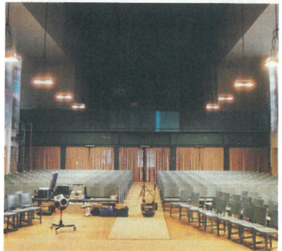
TYPISCH: Der strahlende Klang der Jesus-Christus-Kirche in Berlin kennzeichnet zahlreiche Aufnahmen von Furtwängler, Fricisay und Karajan.