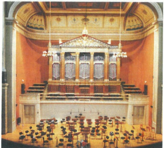
FESTLICH: Die Dvorák Hall in Prag fasziniert durch ihre festliche Atmosphäre und ihren brillanten Klang.